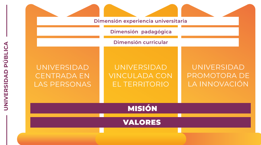
Fig. N°1: Modelo Educativo de la Universidad de Talca

El Modelo Educativo de la Universidad de Talca se enmarca en tres principios rectores: universidad centrada en las personas; universidad vinculada con el territorio; y universidad promotora de la innovación (ver Figura N°1). Estos principios establecen tres dimensiones del proceso formativo (curricular, pedagógica y experiencia universitaria) que definen materias relativas al enfoque curricular, perfil de egreso, enseñanza y aprendizaje, compromiso estudiantil, entre otras. Así, el Modelo Educativo ratifica el principio de la universidad vinculada al territorio, asegurando la pertinencia de los programas formativos.